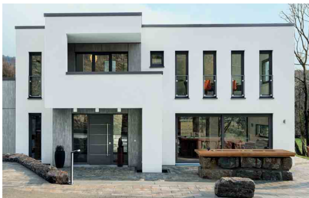
Schüco LivIng forme la base parfaite pour des portes d'entrée modernes, contemporaines.

La porte d'entrée est la carte de visite d'une maison et confère charme et esthétisme à l'entrée. Mais la porte ne doit pas être convaincante uniquement du point de vue esthétique. La fonctionnalité et la longévité sont tout aussi importantes. Avec Schüco LivIng, vous pouvez trouver la porte d'entrée qui satisfait vos exigences. Concevez votre nouvelle porte d'entrée en PVC exactement d'après vos propres idées et en fonction de vos préférences. Parallèlement, Schüco LivIng offre une technologie innovante qui permet une isolation thermique optimale digne d'une maison passive et une protection supérieure contre les effractions jusqu'à la classe de résistance 2 (RC2).